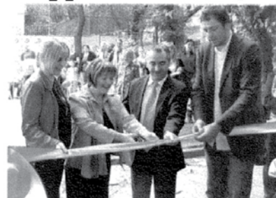
ЗА НАЈМЛАЂЕ: Представници Еуробанк ЕФГ и Владе Дивац

Дивац је изразно задовољство брзином којом је обновљено игралиште у оквиру ове акције. Посебна мотивација коју сам имао да се придружим овој хуманитарној акцији је промовисање спорта од најмлађег доба и упућивање деце на тимски дух и правилан развој. Такође, ово је један од наједноставнијих начина да пословни људи и други корисници кредитних картица подрже лепше детињство деце која похађају државне вртиће.