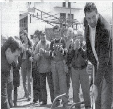
Владе Дивац у родном Пријеполју присуствовао почетку изградње станова за избеглица