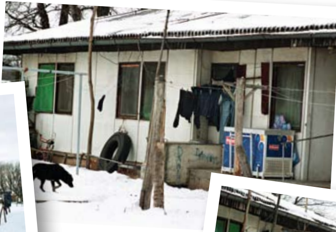
Kolektivni centar Krnjača, zima 2010.